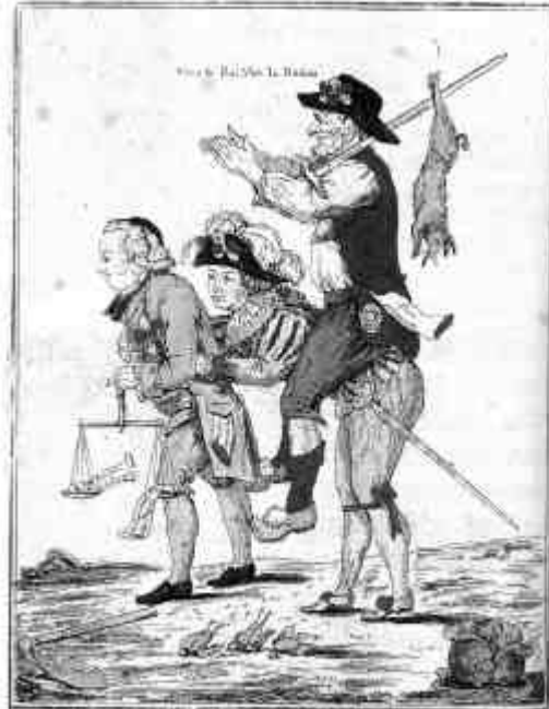
«S'VITEZ BEN QU'Z'AUHONS NOT' JOUR...»