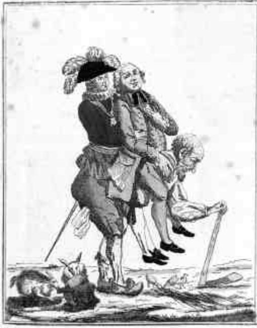
A FAUT ESPERER Q'YU SE JEUE LA FINIRA BUN'FOT